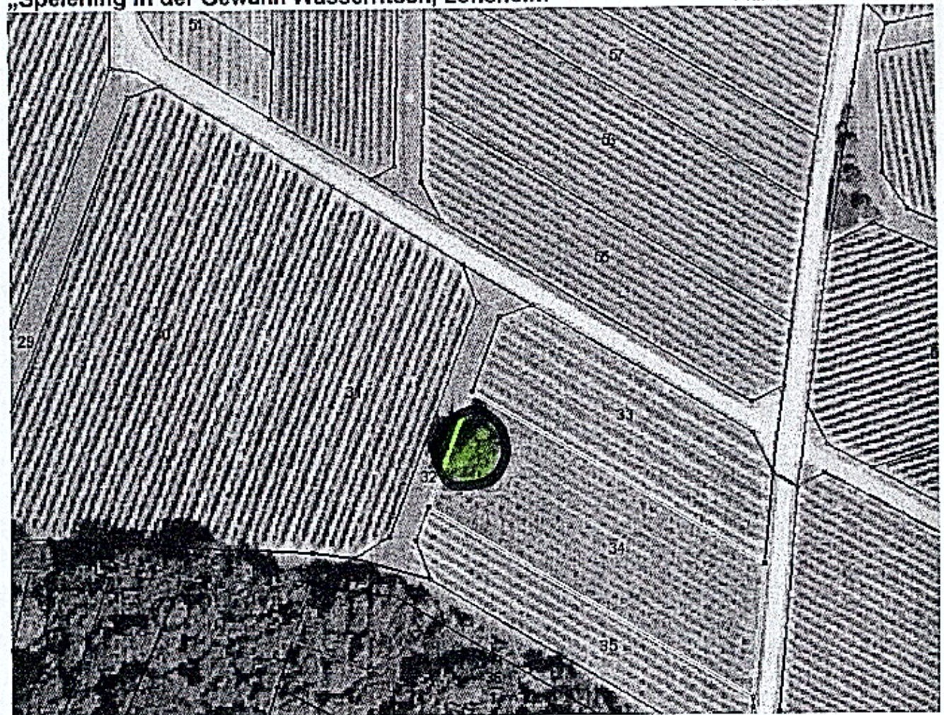
M 1:10.000 - Übersichtskarte