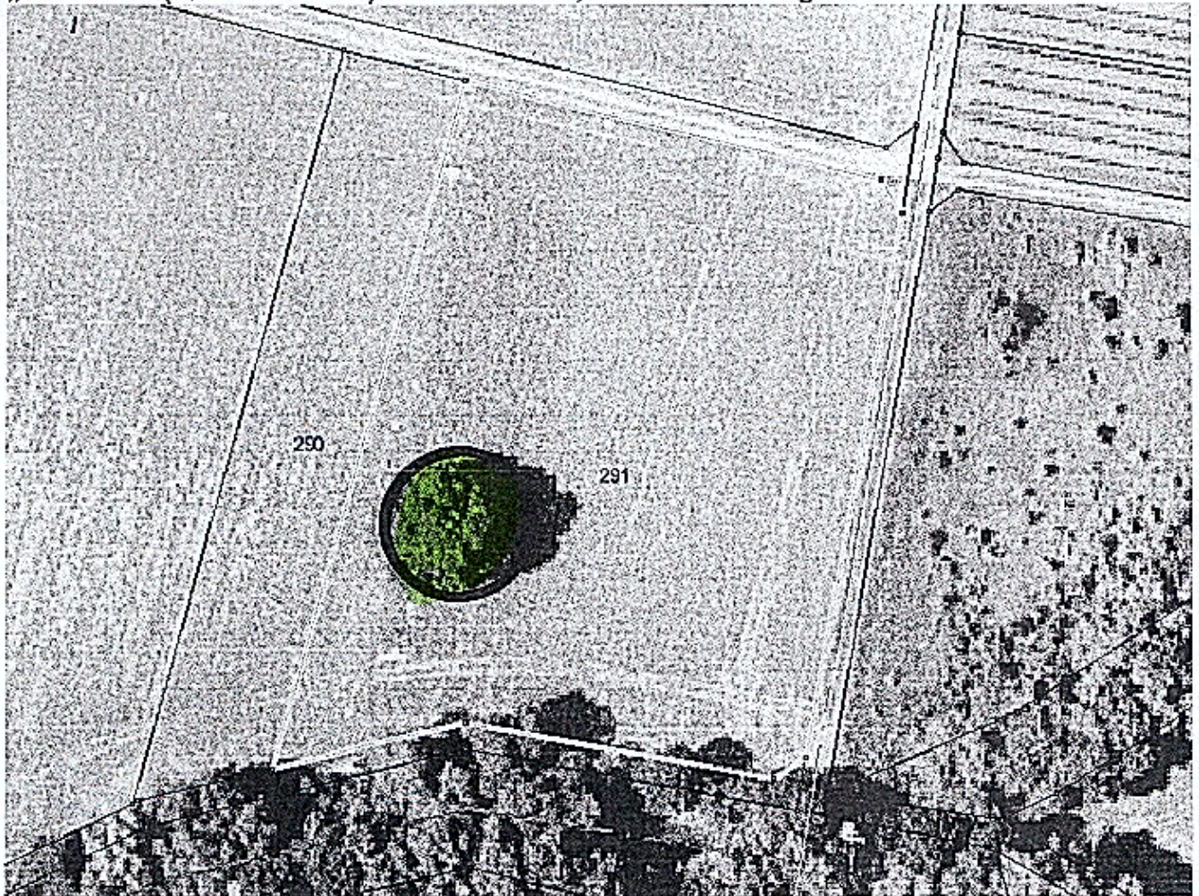
M 1: 10.000 - Übersichtskarte